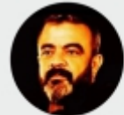
ERDAL KESİCİ GAZETECİ