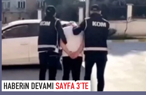
HABERİN DEVAMI SAYFA 3'TE

Nevşehir'in de aralarında bulunduğu 71 ilde ruhsatsız silah taşıyan şahıslara ve silah kaçakçılara yönelik 4 gündür devam eden 'Mercek-16' operasyonları çerçevesinde 912 ruhsatsız silah ele geçirildi, 959 şüpheli gözaltına alındı.