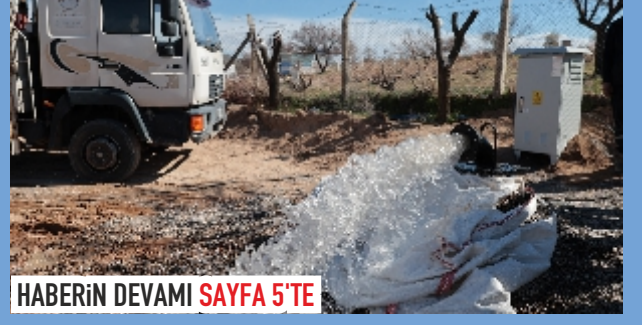
HABERİN DEVAMI SAYFA 5'TE

Nevşehir Belediyesi, Su ve Kanalizasyon Müdürlüğü marifetiyle yürüttüğü çalışmalar ile şehrin içme suyu kaynaklarına alternatif kaynaklar kazandırmaya devam ediyor. Bu kapsamda belediye ekipler Arzu Kamber bölgesinde şehre alternatif yeni bir içme suyu kaynağı kazandırdı.