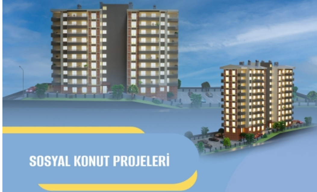
SOSYAL KONUT PROJELERİ