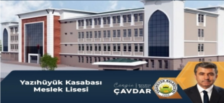
Yazıhüyük Kasabası Meslek Lisesi