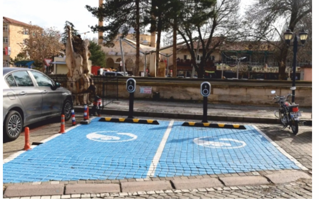
koordinatlar, istasyon kullanımı ve diğer detaylı bilgileri için TRUGO

bulunuyoruz. Türkiye genelinde Avanos ölçeğindeki bir ilçede yerel yönetimler tarafından bugüne kadar hayata geçirilmiş en geniş istasyon ağına sahip bu projeyi kıymetli halkımızın hizmetine sunuyoruz." İfadelerine yer verildi. Şarj istasyonu olan yerler ise şu şekilde, PTT karşısı otopark 2 adet 22 KW AC şarj istasyonu. Pazar yeri açık otopark 2 adet 22 KW AC şarj istasyonu. Belediye yanı açık otopark 3 adet 22 KW AC şarj istasyonu, Yeni adliye önü otopark 2 adet 22 KW AC şarj istasyon. Heykel arkası çukur camii otopark 2 adet 22 KW AC şarj istasyonu. Çavuşin köy meydanı otopark 2 adet 22 KW AC şarj istasyonu. Orta Mahalle Camii önü otopark 2 adet 22 KW AC şarj istasyonu. Ayrıca lokasyonların uygunluk durumu,