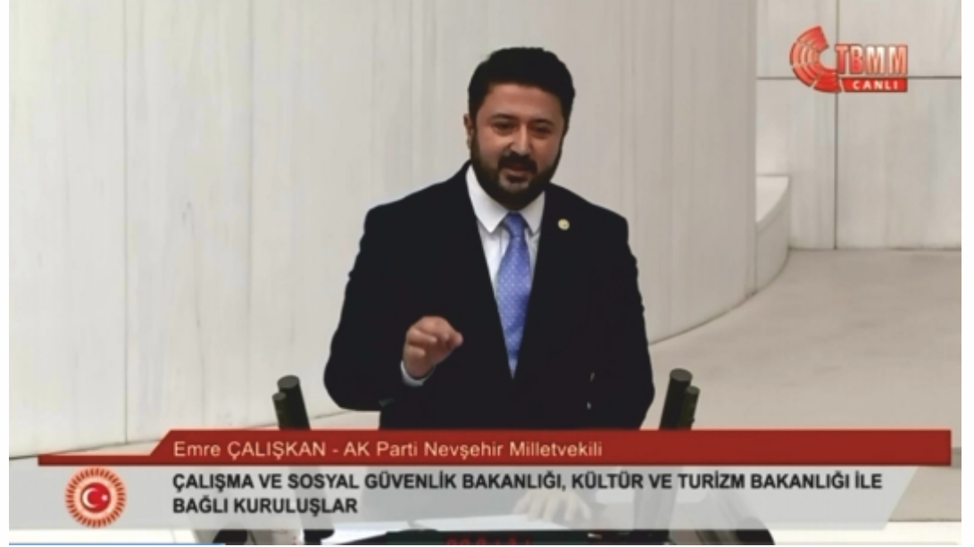
Emre ÇALIŞKAN - AK Parti Nevşehir Milletvekili

Kapadokya'nın güzel ve büyüğü coğrafya olduğundan bahseden Milletvekili Çalışkan, bölgenin güzelliğini tarif eden her cümlelerin yetersiz kalacağını söyledi. Çalışkan'ın konuşmaya damgasını vuran "İddialı konuşuyorum, ilk görüşte aşkı hayatınızda ilk kez bir şehre karşı hissedeceksiniz." cümlesi büyük alkış aldı. AK Partili birçok milletvekili konuşmasının sonunda Milletvekili Çalışkan'a teşekkür etti. HABER: SEZER ALTUNOK