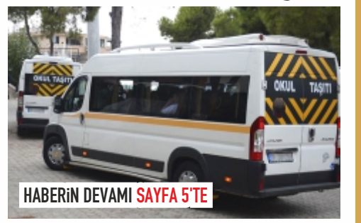
HABERİN DEVAMI SAYFA 5'TE

Nevşehir ve ilçelerinde 2023-2024 eğitim ve öğretim yılı öğrenci servis ücretleri belirlendi.