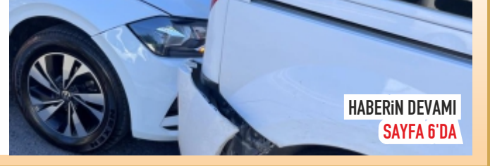
HABERİN DEVAMI SAYFA 6'DA

Nevşehir'de karayollarının yol yapım çalışması nedeniyle kapatılan yollar şehir trafiğini kilitledi.