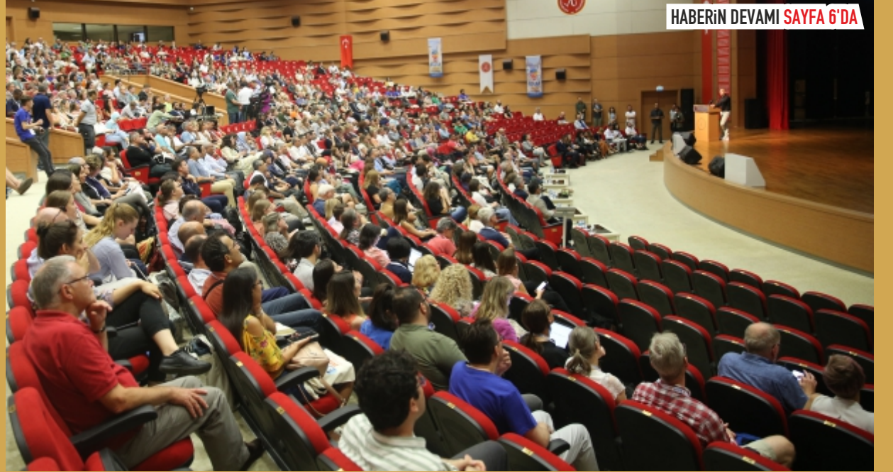
HABERİN DEVAMI SAYFA 6'DA

Avrupa Bilim Eğitimi Araştırma Derneği (ESERA) tarafından düzenlenen "ESERA 2023 Konferansı" Nevşehir'de başladı.