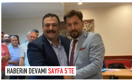
HABERİN DEVAMI SAYFA 5'TE

CHP'nin yeni Merkez İlçe Başkanı yapılan seçimle belli oldu.