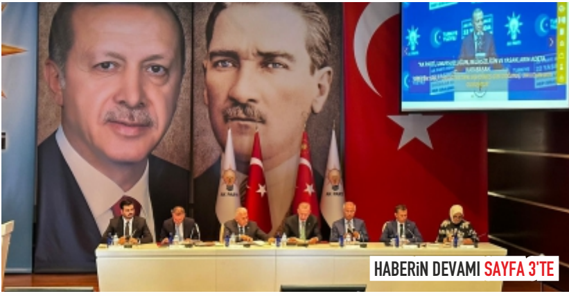
HABERİN DEVAMI SAYFA 3'TE

Avrupa Bilim Eğitimi Araştırma Derneği (ESERA) tarafından düzenlenen "ESERA 2023 Konferansı" Nevşehir'de başladı.