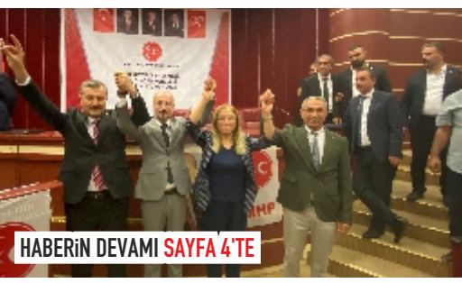
HABERİN DEVAMI SAYFA 4'TE

MHP'nin yeni Merkez İlçe Başkanı yapılan seçimle belli oldu.