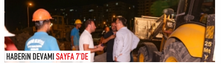
HABERİN DEVAMI SAYFA 7'DE

Nevşehir Belediyesi tarafından içme suyu ana isale hattında gerçekleştirilen olan yenileme çalışması tamamlandı.