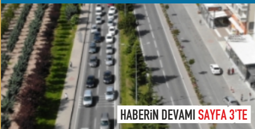
HABERİN DEVAMI SAYFA 3'TE

Nevşehir'de araç sayısı bir önceki yılın temmuz ayına göre yüzde 6 arttı Türkiye İstatistik Kurumu (TÜİK) verilerine göre temmuz ayı sonu itibarıyla Nevşehir'de trafiğe kayıtlı araç sayısı 142 bin 282 oldu.