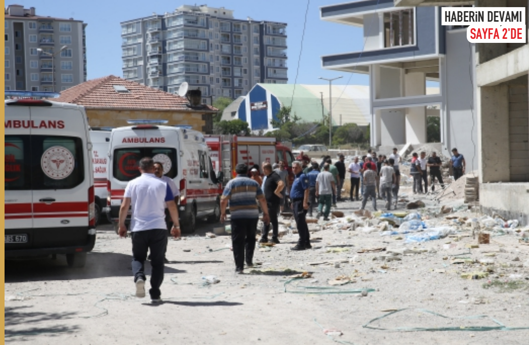
HABERİN DEVAMI SAYFA 2'DE

Nevşehir'de bir bina inşaatında iskelenin çökmesi sonucu 2 işçi yaşamını yitirdi, 1 işçi yaralandı.