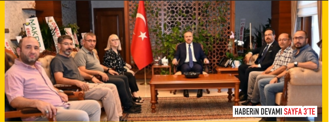
HABERİN DEVAMI SAYFA 3'TE