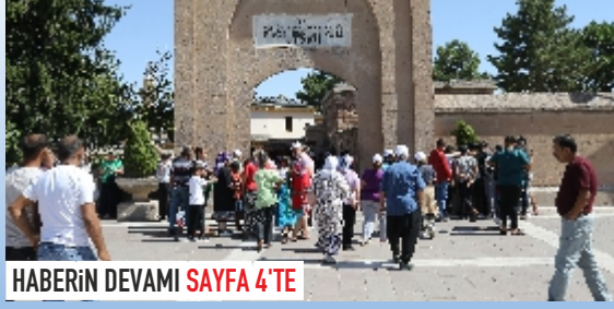
HABERİN DEVAMI SAYFA 4'TE

Nevşehir'in Hacıbektaş ilçesinde düzenlenen 60. Ulusal, 34. Uluslararası Hünkar Hacı Bektaş Veli Anma Törenleri ve Kültür Sanat etkinliklerinde yerli ve yabancı ziyaretçi yoğunluğu yaşandı. 12 Ağustos tarihinde başlayan anma etkinliklerine yaklaşık 135 bin kişi katıldı.