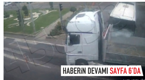
HABERİN DEVAMI SAYFA 6'DA

Nevşehir'de otobüs ile tırın çarpıştığı kaza ucuz atlatılırken, o anlar Kent Güvenlik Yönetim Sistemi (KGYS) kameralarınca saniye saniye kaydedildi.